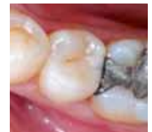
2007 Die gleiche Restauration nach zwölf Jahren