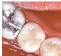
1995 Endergebnis nach Ausarbeitung und Politur