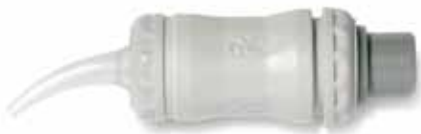
Sechs Minuten Abbindezeit mit „normalhärtendem“ GC Fuji IX GP