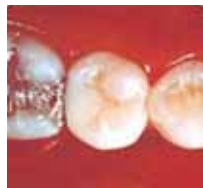
1998 Die gleiche Restauration nach drei Jahren