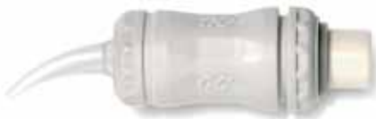
Drei Minuten Abbindezeit mit „schnellhärtendem“ GC Fuji IX GP FAST