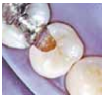
1995 Präparierte Kavität nach der Konditionierung

300 Millionen applizierte Restaurationen weltweit machen sie zum GOLD-STANDARD für Glasionomer-Restaurationen.