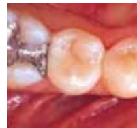
2001 Die gleiche Restauration nach sechs Jahren